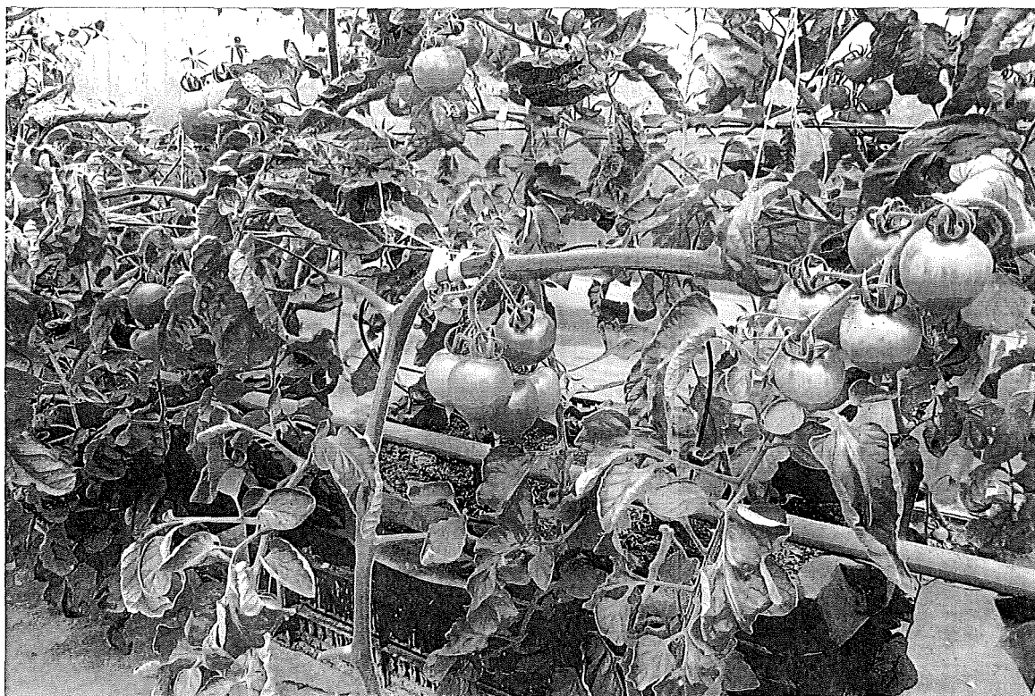
戶外生態學習 ~ 桃太郎蕃茄品種