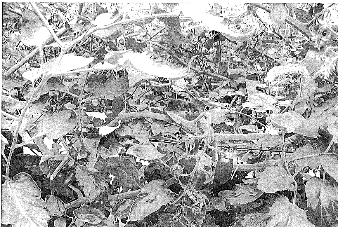
戶外生態學習 ~ 聖女蕃茄品種