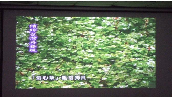
認識獨具風格的『燈心草』。