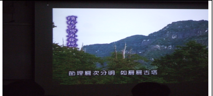
大塔山節理層次分明，如層層古塔般而得名。