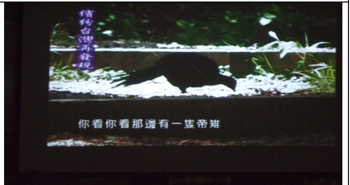
帝雉很特別，會選擇特有種植物天南星來吃。