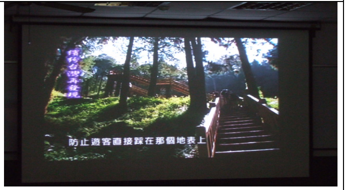
鋪設木棧道行走，防止遊客直接踩在地表上。