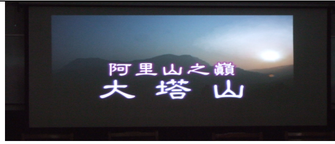
環境教育影片欣賞：阿里山之巔---大塔山。