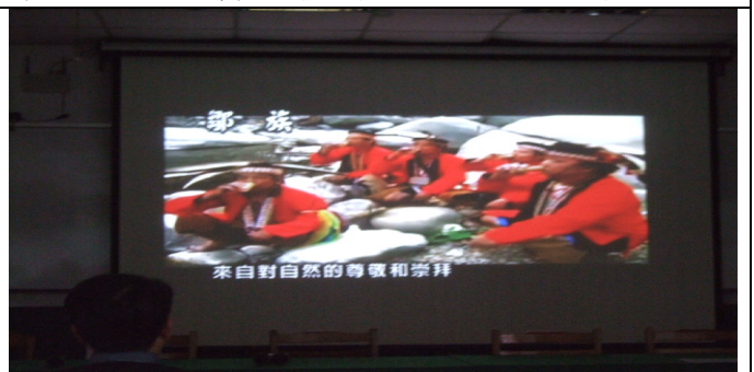
對自然的尊敬與崇拜型塑出阿里山鄒族文化。