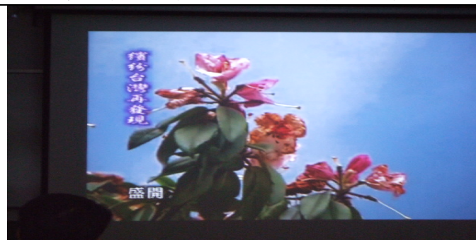
三到五月雨季來臨時，正是森氏杜鵑盛開的時節。