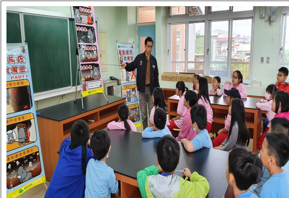
邀請國泰產業為學生辦理消防逃生宣導