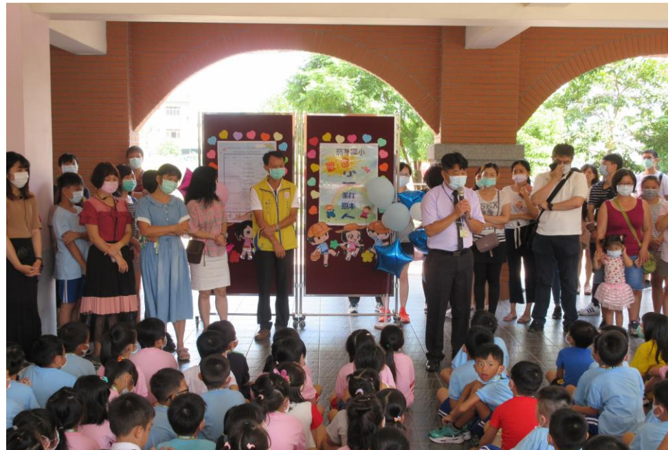
校長歡迎新生，介紹校園環境。