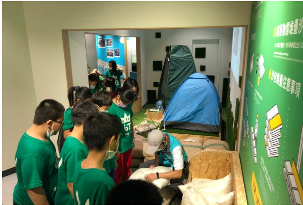
沙包堆疊方式介紹