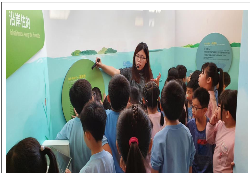
外來種福壽螺對生態造成的影響解說