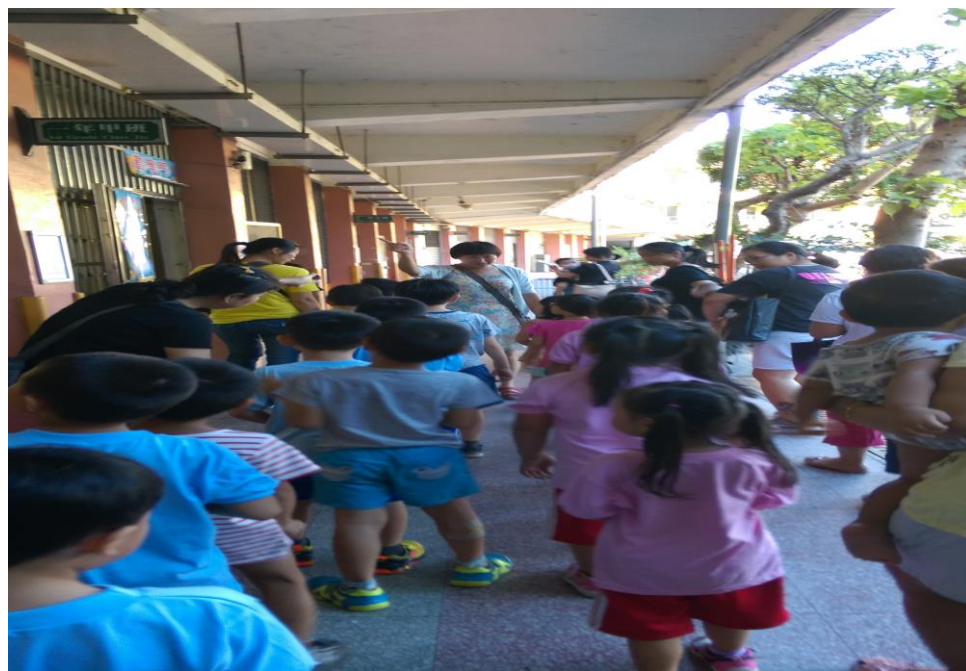
班級導師介紹校園環境