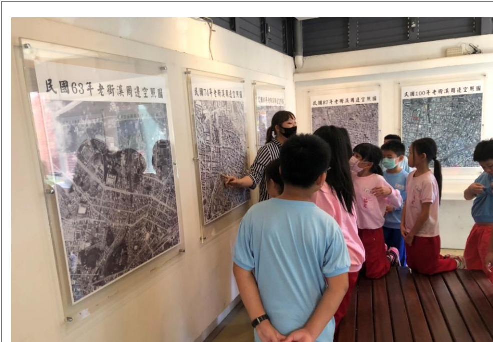
老街溪的舊時空照圖